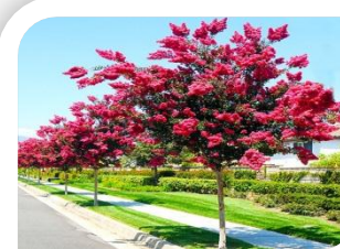
Lanterneira (grande porte)