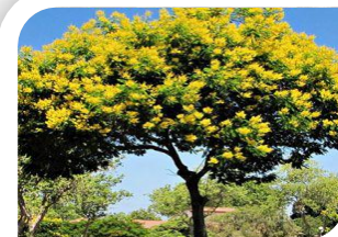
Ipê de jardim (porte médio)