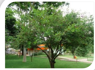
Romã (pequeno porte)