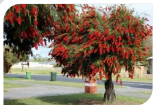
Escova de garrafa (pequeno porte)