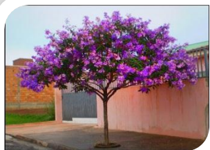
Quaresmeira roxa (porte médio)