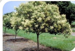
Alfeneiro (pequeno porte)